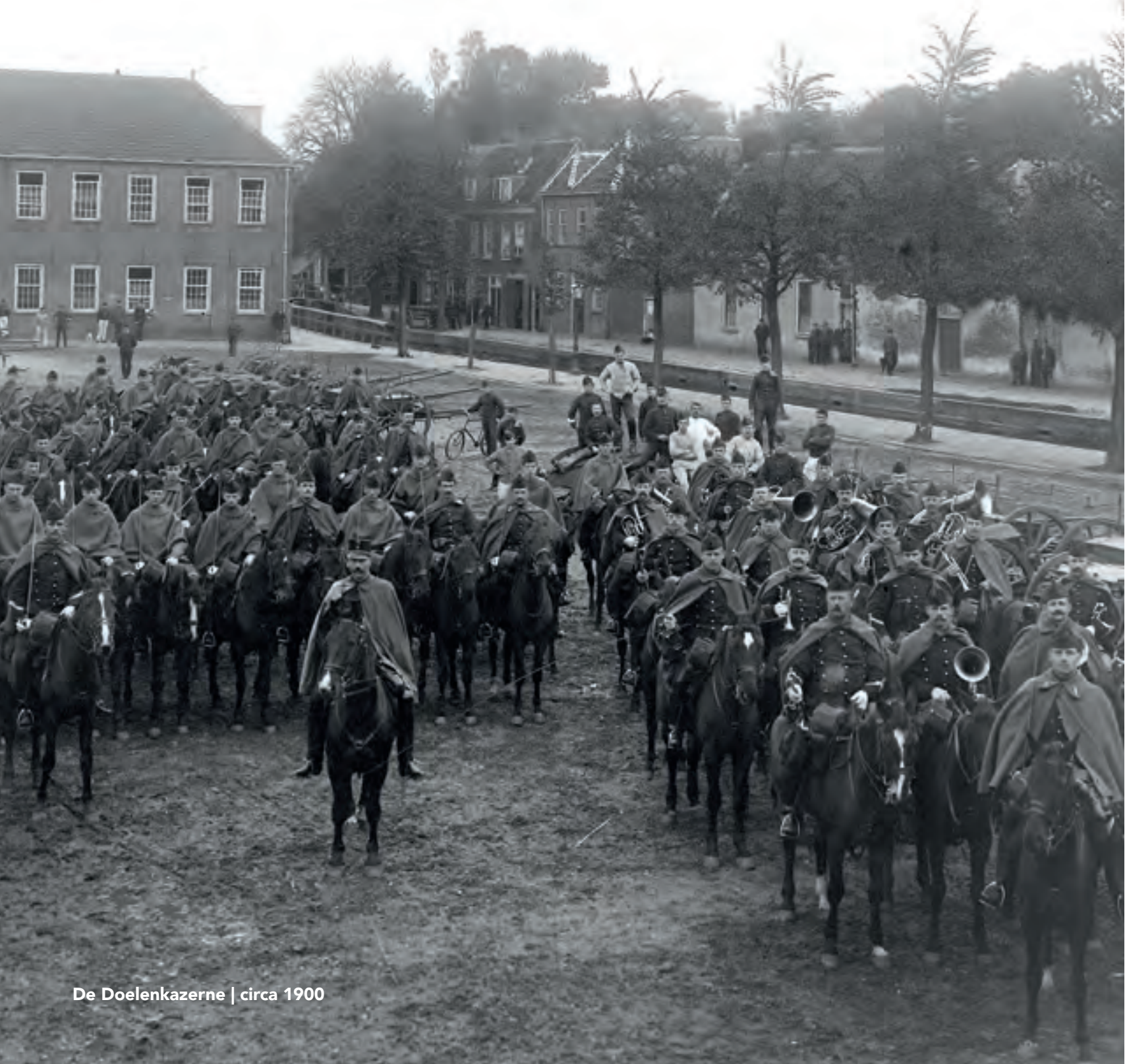
De Doelenkazerne | circa 1900