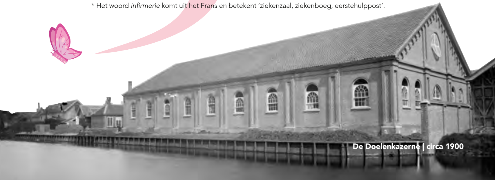
De Doelenkazerne | circa 1900